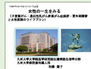
3時限目 加藤先生講義資料より